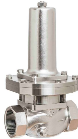
DN 40 - DN 50